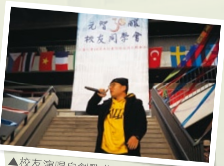
▲校友演唱自創歌曲30釀