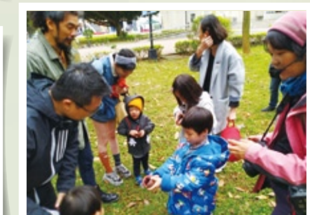
▲小小元智生態多-親子體驗