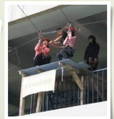
▲全民國防教育多元活動-單繩滑降