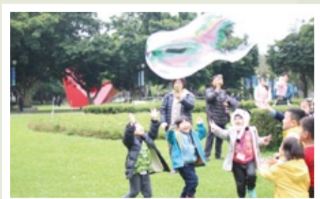
▲社區藝術節-怪獸泡泡